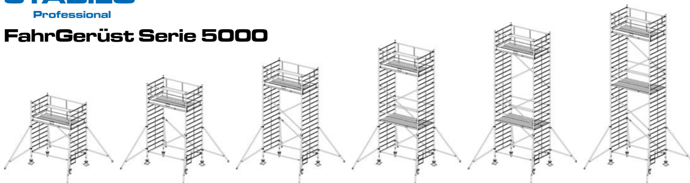
Arbeitshöhe: 4,30 m Gerüsthöhe: 3,30 m Standhöhe: 2,30 m